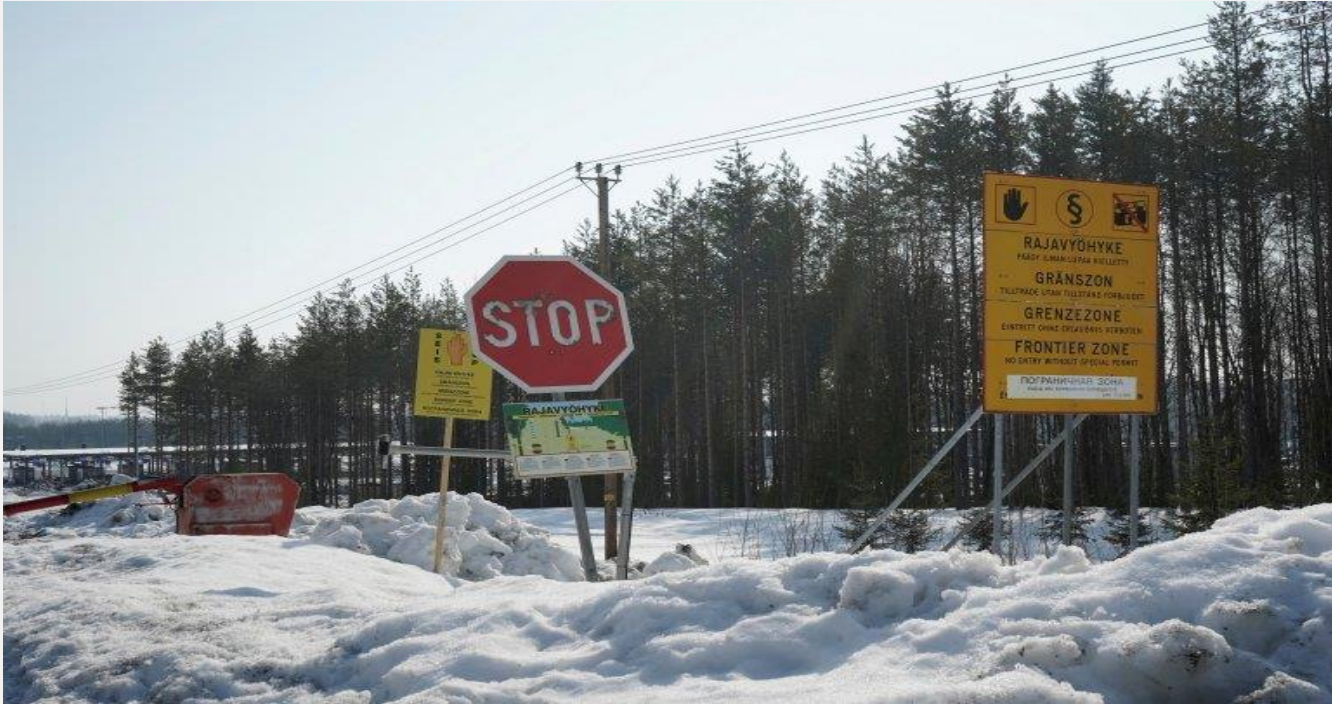
مرز میان فنلند و روسیه، شهر ایماترا.